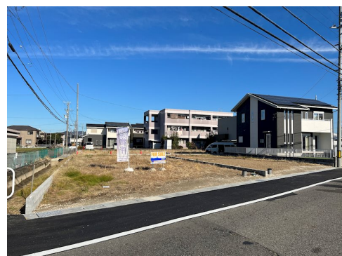
南側前面道路側溝工事10月完了予定

現況と異なる場合には現況を優先します。 該当物件が建築条件付き宅地だった場合、土地売買契約締結後3カ月以内に売主と住宅の建築請負契約を締結していただくことを条件として販売いたします。 この期間内に住宅を建築しないことが確定したとき、または住宅の建築請負契約が成立しなかった場合は、土地売買契約は無効となり、 受領した金額は全額無利息でお返しします。